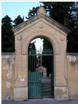
L'entrée des protestants

Un ensemble qui mérite le temps d'une visite.