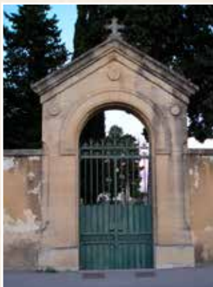
L'entrée des catholiques

À la sortie de la Voie, prenez à gauche la rue de la Cave.