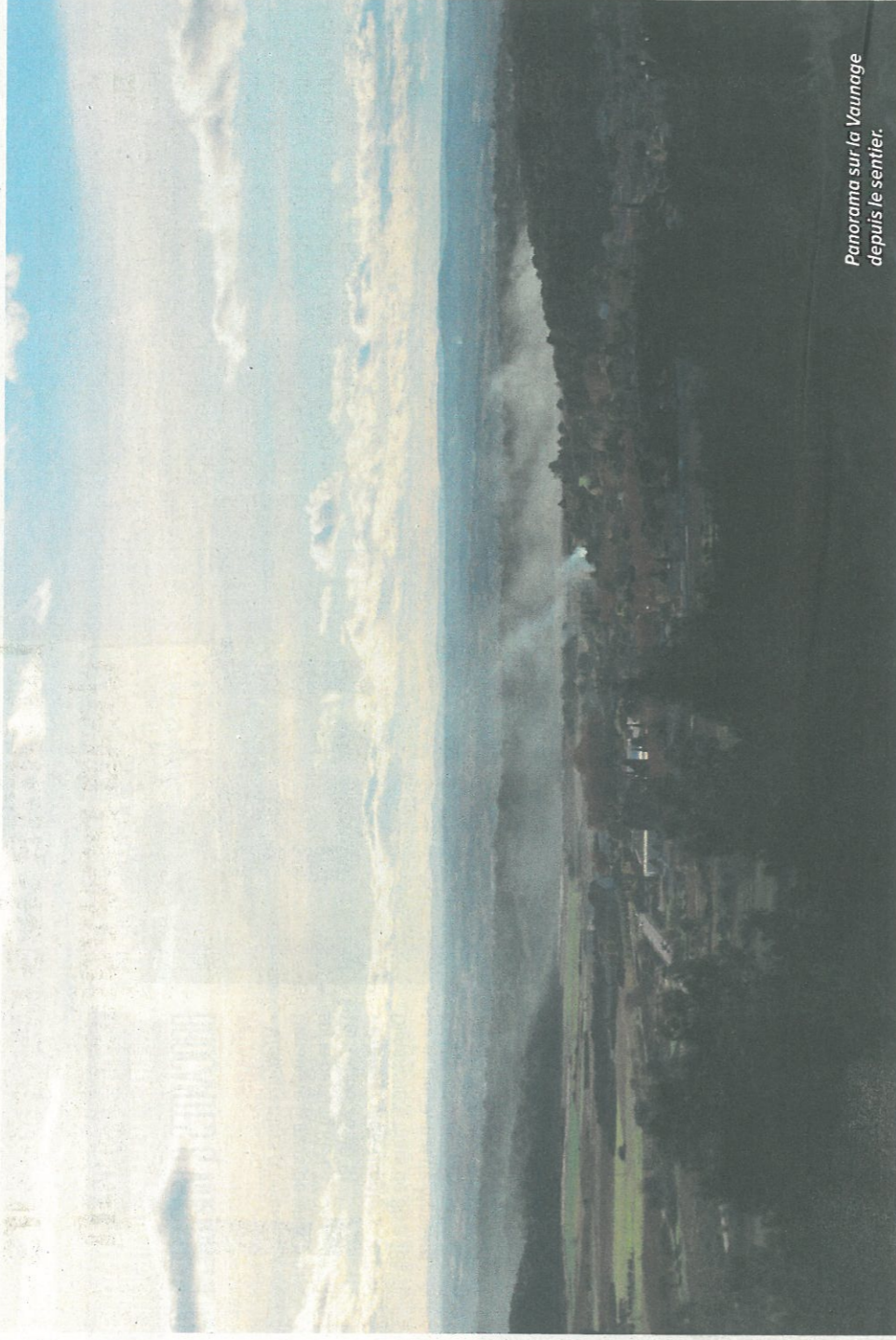
Panorama sur la Vaunage depuis le sentier.